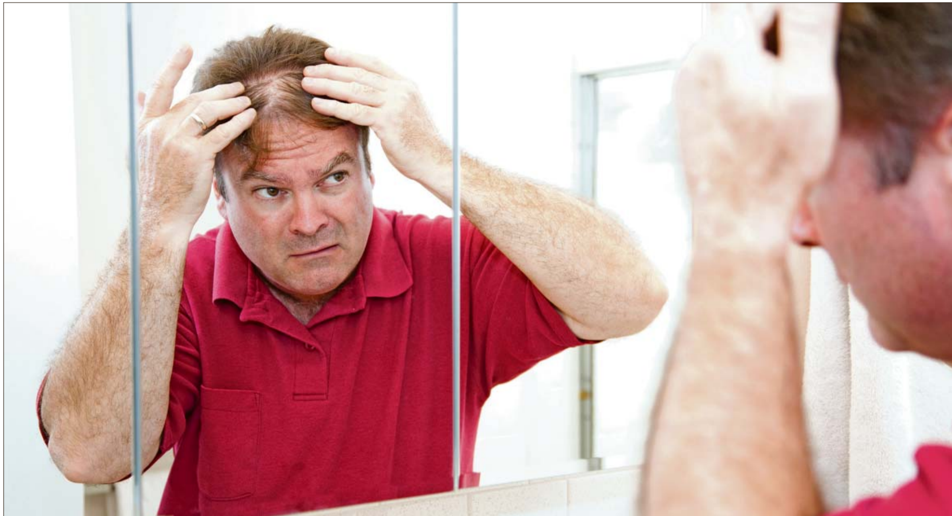
En la última década, los trasplantes capilares han aumentado un 85%, tanto en hombres como en mujeres.